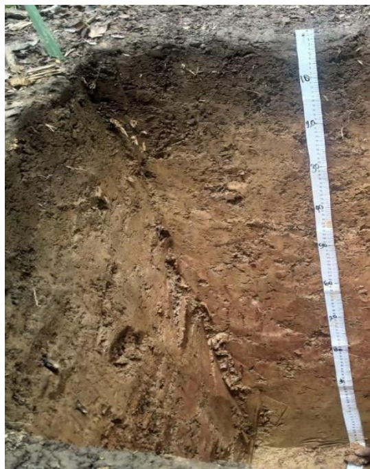
Gambar 1. Profil Tanah Di Lokasi Penelitian

Morfologi tanah merupakan bagian dari pedologi yang mengkaji tanah sebagai benda alami di permukaan bumi, tanpa mengkaitkannya dengan produksi tanaman. Sifat morfologi tanah yaitu sifat-sifat tanah yang dicerminkan oleh susunan horizon/lapisan tanah serta sifat-sifat fisik, kimia, mineralogy dan biologi masing-masing horizon tersebut. Ditunjang dengan data dan informasi tentang rezim lengas dan suhu tanah (Rayer, 2017). Pengamatan terhadap sifat morfologi tanah, dibuat penampang tanah atau profil tanah, sebagai berikut: