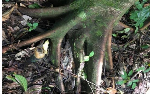
Gambar 17. Akar F. glandulifera (Wall. ex Miq.) King

Akar berbanir, batang bulat, batang keras, batang kasar, batang berwarna putih kehijauan. Daun berwarna hijau, bagian atas dan bawah daun sama-sama kasar, tepi daun kasar, ujung daun meruncing, pangkal daun menumpul. GBIF Secretariat (2021) klasifikasi F. glandulifera (Wall. ex Miq.) King. adalah kerajaan Plantae , divisi Tracheophyta , ordo Rosales , famili Moraceae , genus Ficus dan spesies F. glandulifera (Wall. ex Miq.) King.