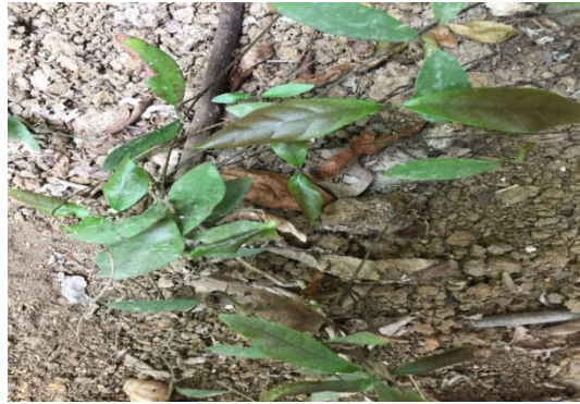
Gambar 12. Daun Toru ( F. lowii King.)