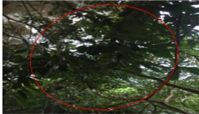
Gambar 10. Pohon Kayu Ara ( F. crassiramea )

GBIF Secretariat (2021) klasifikasi F. crassiramea adalah kerajaan Plantae , divisi Trachheophyta , ordo Rosales , famili Moraceae , genus Ficus dan spesies F. crassiramea .