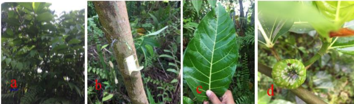
Gambar 11. a) Pohon Putih Susu ( F. lepicarpa Blume.), b) Batang, c) Daun d) Buah

Batang bulat, batang keras, kulit dalam batang berwarna putih, kulit luar batang berwarna coklat, batang kasar. Daun berwarna hijau, daun lebar, bagian atas daun licin, bagian bawah daun kasar, tepi daun kasar, ujung daun meruncing, pangkal menumpul. Buah bulat kecil, buah berwarna hijau berbintik. GBIF Secretariat (2021) klasifikasi F. lepicarpa Blume. adalah kerajaan Plantae , divisi Trachheophyta , ordo Rosales , famili Moraceae , genus Ficus dan spesies F. lepicarpa Blume.