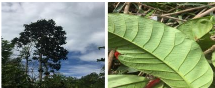
Gambar 5. Pohon dan daun Tampang ( A. nitidus subsp. nitidus .)

Batang keras, batang bulat, berwarna putih, batang licin. Daun berwarna hijau tua, atas daun dan bawah daun sama-sama kasar, tepi daun kasar, ujung daun menumpul, pangkal daun meruncing. GBIF Secretariat (2021) klasifikasi pohon Tampang adalah kerajaan Plantae , divisi Trachheophyta , kelas Magnoliopsida , ordo Rosales , famili Moraceae , Genus Artocarpus dan Spesies A. nitidus subsp. nitidus .