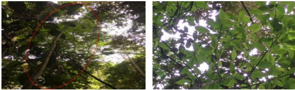
Gambar 8. Pohon dan daun Beringin ( F. variegata Blume. )

Trachheophyta , kelas Magnoliopsida , ordo Rosales , famili Moraceae , genus Ficus L. dan spesies F. variegata Blume.