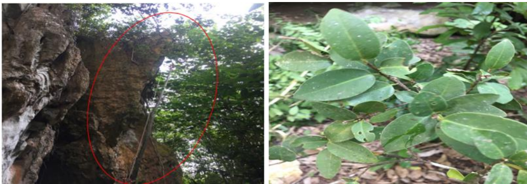
Gambar 13. F. subsecta Corner

Batang bulat, batang berwarna coklat, batang keras, batang licin. Daun berwarna hijau, daun pendek, bagian atas dan bawah daun sama-sama licin, tepi daun licin, ujung daun runcing, pangkal daun menumpul. GBIF Secretariat (2021) Klasifikasi pohon F. subsecta corner adalah kerajaan Plantae , divisi Trachheophyta , ordo Rosales , famili Moraceae , genus Ficus dan spesies F. subsecta Corner.