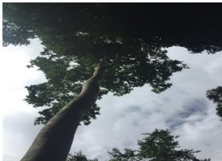
Gambar 15. F. midotis Corner

Batang bulat, batang berwarna putih, batang licin, batang keras. Daun berwarna hijau, bagian atas dan bawah daun sama-sama licin, tepi daun licin, ujung daun runcing, pangkal daun menumpul. GBIF Secretariat (2021) klasifikasi F. midotis corner adalah kerajaan Plantae , divisi Trachheophyta , ordo Rosales , famili Moraceae , genus Ficus dan spesies F. midotis corner .