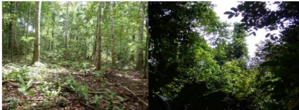
Gambar 1. Kawasan hutan sekunder dan primer

merupakan hutan tropis dan terdiri dari beraneka ragam tumbuhan, terutama tumbuhan tingkat tinggi. Indonesia adalah salah satu negara beriklim tropis yang memiliki keanekaragaman tumbuhan yang sangat tinggi yaitu sekitar 25.000 spesies, dimana 40% diantaranya merupakan tumbuhan endemik Indonesia (Hakim, 2009).