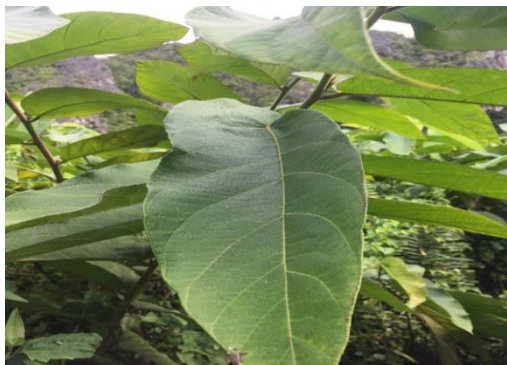
Gambar 16. F. uncinata (King) Becc.)

Batang bulat, batang berwarna coklat, batang kasar, batang keras. Daun berwarna hijau, bagian atas dan bawah daun sama-sama kasar, tepi daun kasar, ujung dan pangkal daun sama-sama meruncing. GBIF Secretariat (2021) klasifikasi F. uncinata (King) Becc. adalah kerajaan Plantae , divisi Trachheophyta , ordo Rosales , famili Moraceae , genus Ficus dan spesies F. uncinata (King) Becc.