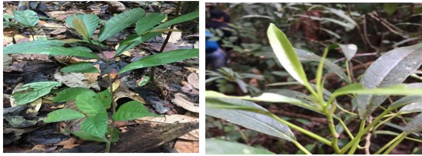
Gambar 14. F. apiocarpa (Miq.) Miq.