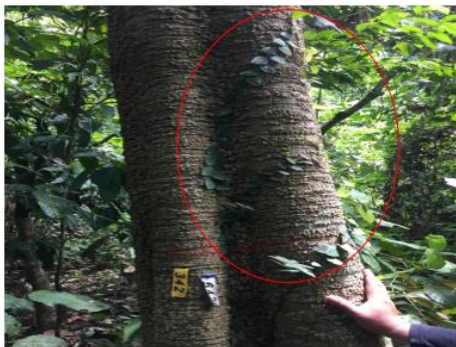
Gambar 6. Pohon Ara Bulu ( F. villosa Blume )

Julukan spesies villosa yang berarti daun, batang, dan buah-buahan ditutupi oleh bulu-bulu halus yang panjang serta semua bagian tanaman mengeluarkan getah putih saat memar. GBIF Secretariat (2021) klasifikasi pohon Ara Bulu adalah kerajaan Plantae , divisi Trachheophyta , kelas Magnoliopsida , ordo Rosales , famili Moraceae , genus Ficus L. dan spesies F. villosa Blume .