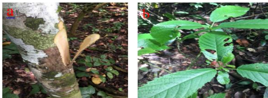
Gambar 18. a). Batang dan b). daun Streblus asper Lour.

Batang bulat, batang keras, batang kasar. Daun berwarna hijau, bagian atas dan bawah daun sama-sama licin, tepi daun bergerigi, ujung daun runcing, pangkal daun menumpul. Serut adalah pohon berukuran kecil dengan cabang yang sangat rimbun dengan tinggi dapat mencapai 14 m. Pohon serut memiliki daun berbentuk jorong yang tersusun berselang-seling. Bagian pangkal daun membulat, ujung lancip atau tumpul. Permukaan daun serut berbulu kasar dengan tulang daunnya menonjol dan tangkai daun pendek (Berg, Corner, & Jarrett, 2006). GBIF Secretariat (2021) klasifikasi serut adalah kerajaan Plantae , ordo Rosales , famili Moraceae , genus Streblus dan spesies Streblus asper Lour.