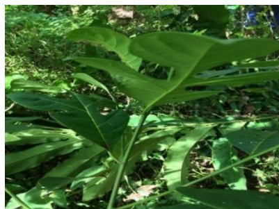
Gambar 3. Pohon Terkalong ( A. elasticus Reinw. ex Blume.)

A. elasticus Reinw. ex Blume mempunyai ciri: berakar banir, batang bulat, batang keras, batang muda berwarna hijau, batang tua berwarna coklat, batang kasar. Daun berwarna hijau, atas daun kasar, bawah daun licin, pangkal daun menumpul, ujung daun meruncing, tepi daun kasar. Randi (2006) terkalong termasuk kedalam famili Moraceae yaitu Artocarpus elasticus . dan tergolong dalam jenis kayu bergetah, tingginya bisa mencapai 7 meter dan diameter batang bisa mencapai 50 cm. A. elasticus Reinw. ex Blume pedalai atau terkalong dan memiliki duri panjang yang fleksibel. kulitnya mudah dikupas, Perianth berdaging berwarna keputihan, rasanya manis menampilkan aroma yang kuat. Bijinya bisa dimakan dengan cara dipanggang (Wong, 1995). GBIF Secretariat (2021) klasifikasi terkalong adalah kerajaan Plantae , divisi Tracheophyta , kelas Magnoliopsida , ordo Rosales , famili Moraceae , Genus Artocarpus dan Spesies A. elasticus Reinw. ex Blume.