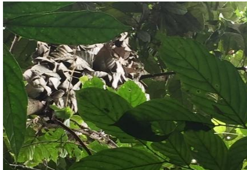
Gambar 4. Daun Mentawa ( A. anisophyllus Miq.)

daun menumpul. Mentawa ( A. anisophyllus Miq.) memiliki pohon yang sangat kuat dan memiliki daun yang panjang dan sempit. Rasa buahnya manis, aromanya enak, tekstur buahnya lunak dengan biji keras (Purwanto & Andrasmara, 2019). A. anisophyllus Miq. adalah famili Moraceae sering dikonsumsi sebagai buah dan juga dapat dikonsumsi dalam bentuk sayur (Wibowo et al. , 2019). Indriyani & Ihsan (2015) nama lain dari mentawa adalah mentawak, tarap ikal, bakil, pupuan, keledang babi, mentaba, puan, dan bintawak. GBIF Secretariat (2021) klasifikasi pohon Mentawa adalah kerajaan Plantae , divisi Trachheophyta , kelas Magnoliopsida , ordo Rosales , famili Moraceae , Genus Artocarpus dan Spesies A. anisophyllus Miq.