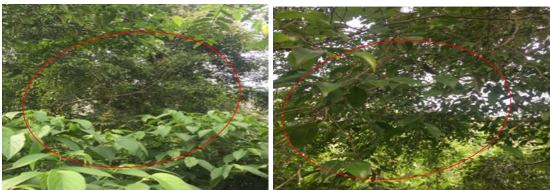
Gambar 9. Pohon Karet ( Ficus consociate Blume. )

Batang bulat, batang keras, batang kasar, dalam batang bergetah, batang berwarna putih coklat. Daun berwarna hijau, bagian atas dan bawah daun sama-sama kasar, tepi daun kasar, ujung daun meruncing, pangkal daun menumpul. National Park (2021a) Ficus consociate Blume memiliki rantingnya berbulu lebat dan helaian daun kasar berbulu lebat berselang-seling serta bertangkai. Bunganya kecil dan berkelamin tunggal. Spesies Ficus consociate Blume adalah spesies berumah satu, bunga jantan dan betina menjadi satu pada bagian khusus tanaman yang dikenal sebagai syconium. Buahnya tanpa tangkai menempel di ranting dan bulat, lebar 1,5 cm dan pada saat matang warnanya menjadi merah-oranye. GBIF Secretariat (2021) klasifikasi F. consociate Blume. , adalah kerajaan Plantae , divisi Trachheophyta , ordo Rosales , famili Moraceae , genus Ficus dan spesies F. consociata Blume.