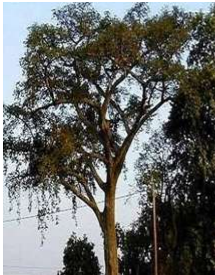
Gambar 1. Pohon Antiaris toxicaria di agroekosistem

lateks (getah) bewarna putih susu dan daun simetris (Gan et. al., 2008 ; Que et al. 2009; Carter et al., 1997), bunga jantan dan betina kurang berkelopak. Buah pada tanaman spesies ini sebagian besar berpolong (Fujimoto, et al., 1992; Dai et. al., 2010.). A. toxicaria ditemukan di hutan kering dan basah serta di padang rumput berhutan (preiri) tropis. Hutan sekunder merupakan habitat yang umum dapat ditemui tanaman ini karena kemampuan tumbuh yang sangat tinggi dalam persaingan dengan tanaman di lingkungannya (Gambar 1). Memiliki banyak nama daerah di pulau Kalimantan dikenal sebagai tanaman ipoh (tanaman racun) dan nama lain seperti Akede, Ako, Andoum, jelmu dan beberapa nama daerah.